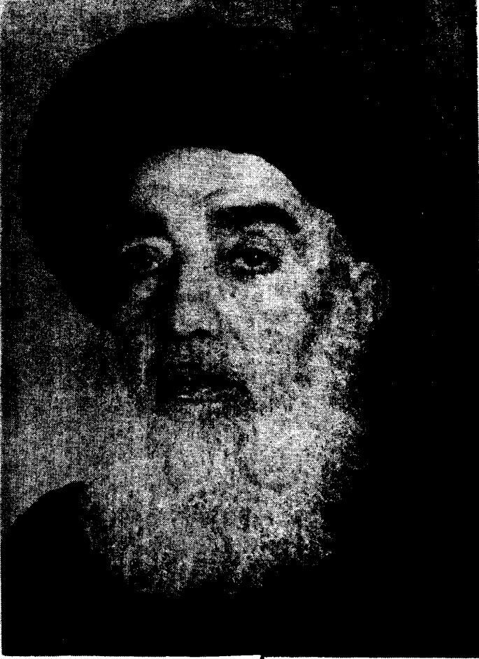
تمثال المؤلف العلامة آية الله الحاج السيد أحمد المستنقب (قدس سره)